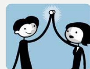
Zlepšujeme místo k životu